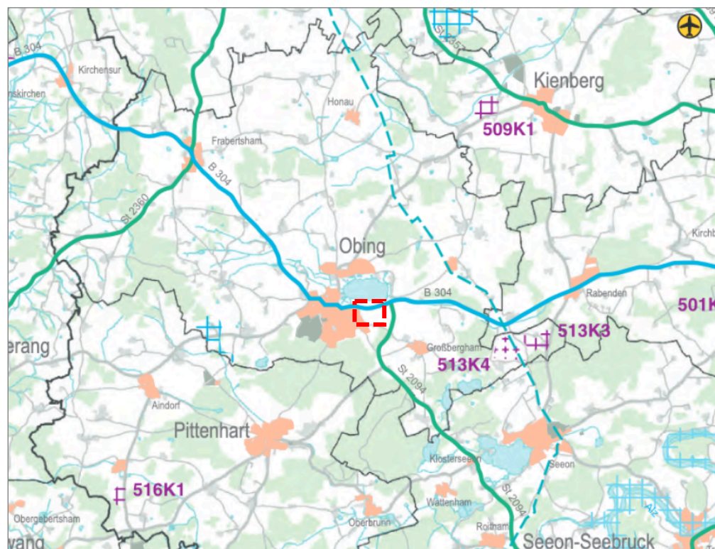
Abbildung 1: Ausschnitt Regionalplan Südostoberbayern - Karte 2 Siedlung und Versorgung (Stand: 28.10.2017; Quelle: Regionaler Planungsverband Südostoberbayern)

Nach Karte 3 „Landschaft und Erholung“ liegen keine Aussagen für das Planungsgebiet vor. Südlich von Obing liegt ein „Landschaftliches Vorbehaltsgebiet“. Regionale Grünzüge oder Trenngrün werden um Obing herum nicht dargestellt.