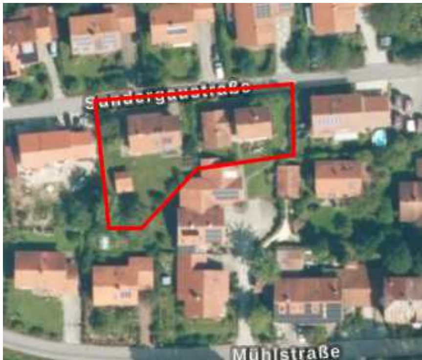
Luftbild

Planfassung: 18. März 2025 / 10. Juni 2025