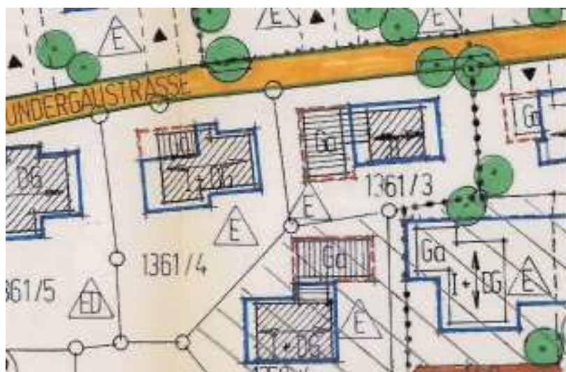
Auszug rechtsverbindlicher Bebauungsplan (nicht maßstäblich)

Als Planungsgrundlage wurde die digitale Flurkarte der Gemeinde Obing zu Grunde gelegt.