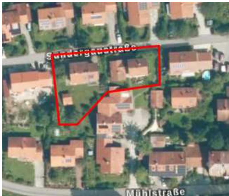
Luftbild

Das Bauland ist als "Reines Wohngebiet" (WR) im Sinne von § 3 BauNVO festgesetzt.